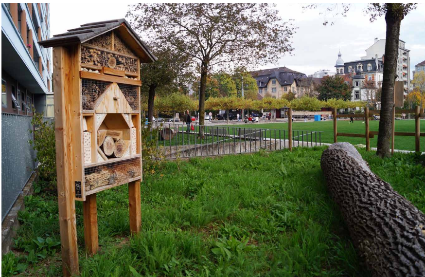
Fläche zur Förderung der Biodiversität, die im Stadtteil Pérolles eingerichtet wurde.

Für weitere Details können die drei Teile des landwirtschaftlichen Gutachtens (1. Pflanzenschutz, 2. Analyse der kantonalen Biodiversitätsstrategie, 3. Fauna und Flora) auf unserer Website kostenlos heruntergeladen werden.