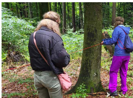
Sensorischer Parcours, um den Wald neu zu entdecken; Wald-Rallye am 24. September.

Die Geheimnisse des Waldes wurden anlässlich des öffentlichen Tages gelüftet, den wir in Zusammenarbeit mit SILVIVA am Samstag, 24. September im Wald des Brugeraholzes in Düdingen organisierten.