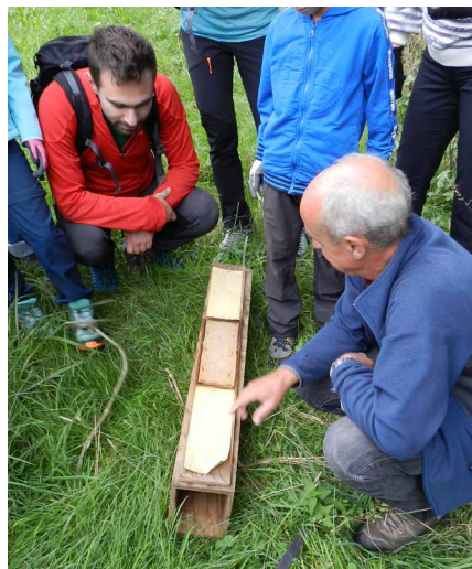
Untersuchung der Fussspuren, die Bilche im Spurentunnel hinterlassen hatten; Exkursion am 10. September.

Wir setzten den Gartenschläfer, den kleinen Zorro mit den langen Schnurrhaaren, der zum Tier des Jahres 2022 gewählt wurde, als Maskottchen von drei Sensibilisierungsaktivitäten ein, die wir von August bis Oktober für die breite Öffentlichkeit organisierten. Zunächst fanden zwei Exkursionen in Begleitung von Biologen statt, die auf Bilche (der Gartenschläfer, der Siebenschläfer und die Haselmaus gehören zu dieser Familie von Nagetieren) spezialisiert sind. Der Vanil Noir ist einer der wenigen Orte, an denen der Gartenschläfer in unserem Kanton nachweislich vorkommt. Deshalb fand die erste Exkursion am 28. August mit 13 Personen dort statt. Am Abend des 10. September waren weitere zwölf Personen auf der Spur der Bilche unterwegs, und zwar an der Exkursion nach Pensier. Sie hatten das Glück, Spuren und Nester von Siebenschläfer und Haselmaus zu entdecken. Die Beobachtungen dauerten dank dem Einsatz eines Wärmebildfernglases bis in die Nacht. Die letzte thematische Aktivität fand am 20. Oktober im Naturhistorischen Museum Freiburg in Form eines eintägigen Workshops in zwei Sprachen statt. Auf dem Programm standen Basteln, Spiele und Beobachtungen, bei denen sich sechs Kinder mit dem unauffälligen Nagetier vertraut machten.