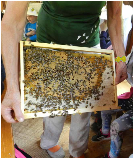
Besuch des Lehrbienenstocks im Pro Natura Zentrum Champ-Pittet durch die Jugendgruppe im Juni.

Unsere Jugendgruppe bot 2022 fünf Exkursionen an, an denen insgesamt 43 Kinder teilnahmen. Für die Zusammenstellung des Ausflugsprogramms nehmen sich jeweils mehrere Personen viel Zeit. Schlussendlich wurde die letzten Jahre leider jeweils nur eine begrenzte Anzahl von Kindern erreicht. Deshalb haben wir beschlossen, die Jugendgruppe zu pausieren und unser Umweltbildungsprogramm zu überdenken. Unser Ziel ist, möglichst viele Kinder, Schulklassen und Familien im ganzen Kanton zu sensibilisieren.