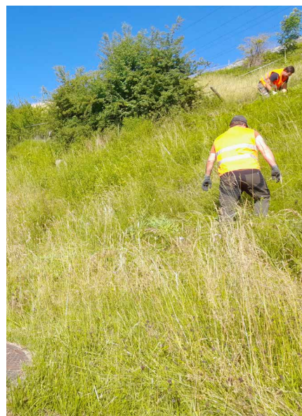
Ausreissaktion von invasiven Goldruten mit Hilfe von Freiwilligen in einem reptilienfreundlichen Biotop in Villars-sur-Glâne.

gepflanzt worden waren, durch das Anlegen von Steinhaufen für die Kleinfafa vorteilhafter gestaltet. Obwohl die von uns verwalteten Grundstücke relativ wenig von der Problematik invasiver Pflanzen betroffen sind, fanden im Juni zwei Ausreissaktionen mit 15 Freiwilligen statt. Sie dienten der Bekämpfung der Ausbreitung der Goldruten, eines invasiven Neophyten, der auf der Böschung entlang der Bahnlinie in Villars-sur-Glâne wächst, die sich in unserem Besitz befindet. Die Aktion soll über mehrere Jahre hinweg wiederholt werden.