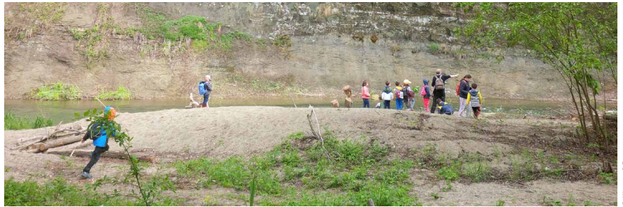
Exkursion auf den Spuren des Bibers entlang der Saane in Freiburg im Mai.

Auflage: 100 Ex. deutsch, 100 Ex. französisch