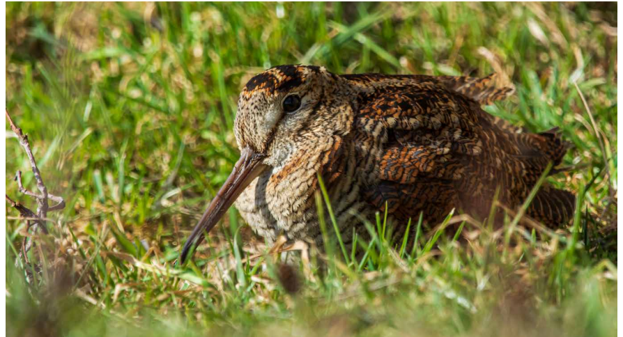
Die unauffällige Waldschnepfe ist auf Waldboden praktisch unsichtbar.

Angesichts des alarmierenden Zustands der Biodiversität in unserem Kanton setzen wir grosse Hoffnungen in die kantonale Biodiversitätsstrategie. Nun mussten wir feststellen, dass der Schutz der Biodiversität nicht auf der politischen Agenda unserer Behörden steht. Der Staatsrat hat bis Ende September eine unvollständige Strategie in die Vernehmlassung geschickt, die